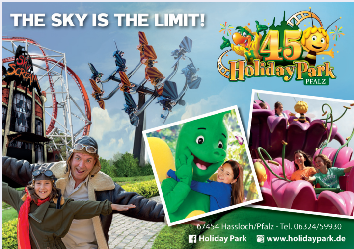
67454 Hassloch/Pfalz - Tel. 06324/59930 Holiday Park www.holidaypark.de

Kommunaler Kindergarten Haus Kunterbunt Trifelsstr. 12 Tel. 98 16 10 hauskunterbunt@hassloch.de