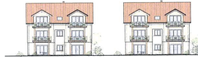
Ostansicht M. 1:200