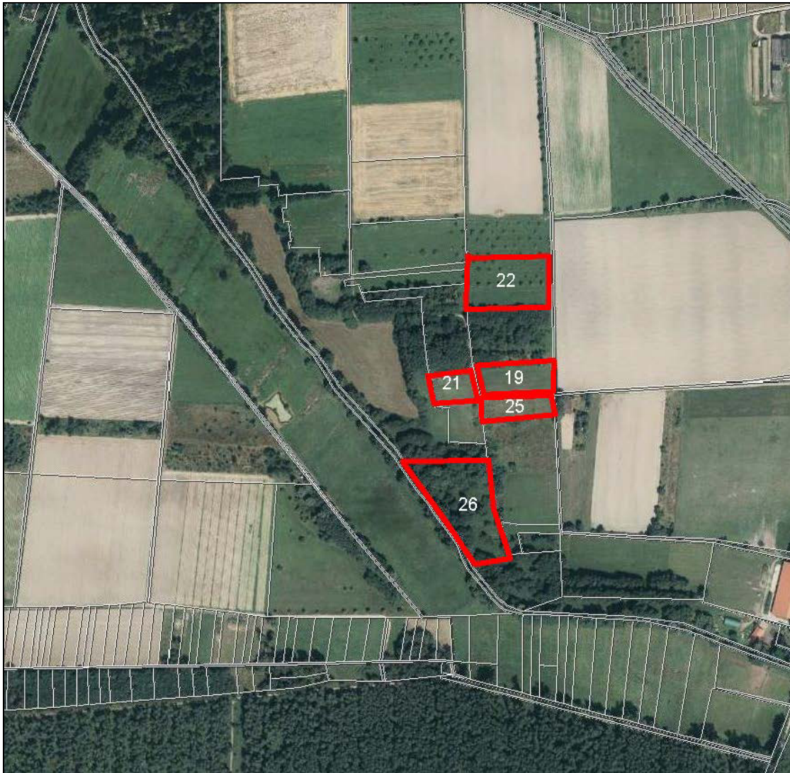
Ökokonto-Flächen der Gemeinde Haßloch mit Ökokonto-ID-Nummer