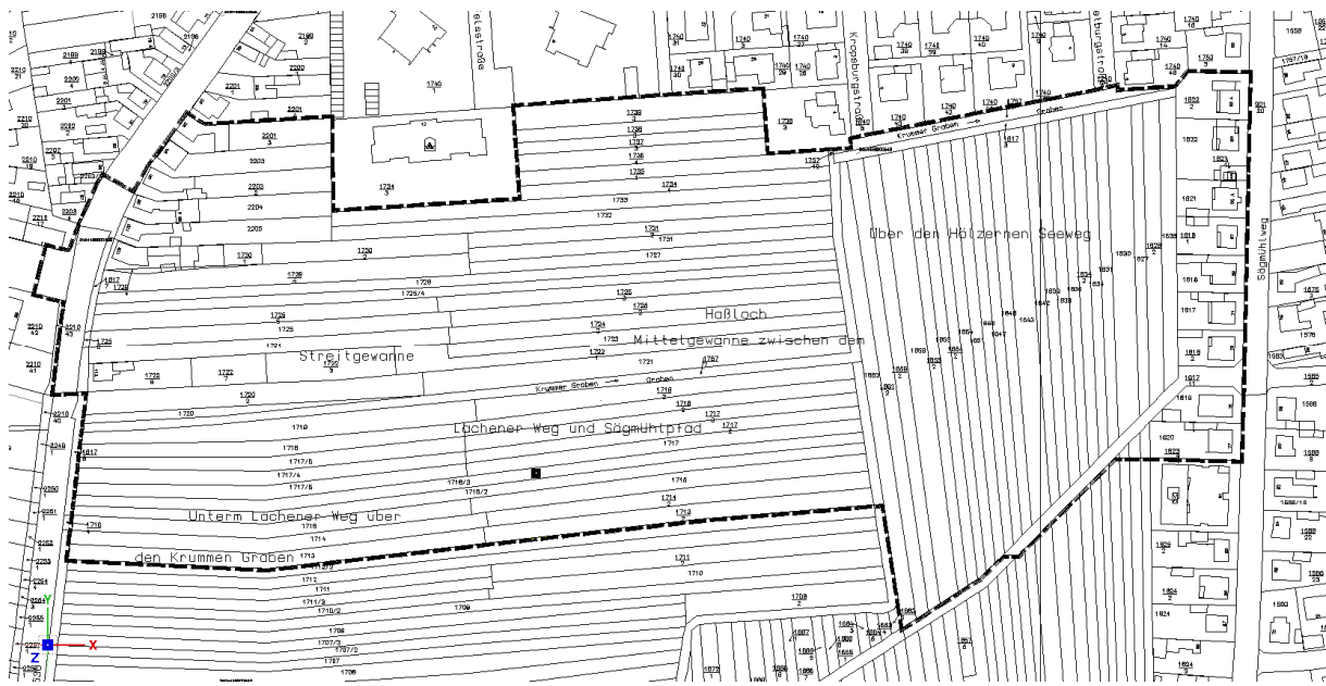
Abbildung 2 - Geltungsbereich des Bebauungsplans

Der Geltungsbereich des Bebauungsplans ist nachstehender Abbildung zu entnehmen.