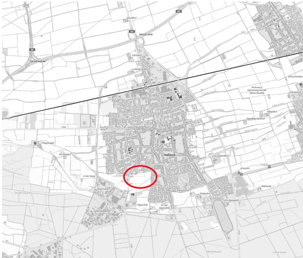
Abbildung 1 - Lage des Plangebiets

Das Gebiet des Bebauungsplans „Zwischen Lachener Weg und Sägmühlweg“ liegt im Süd-Westen der Gemeinde Haßloch zwischen der Ortslage Haßloch und dem Industriegebiet Süd.