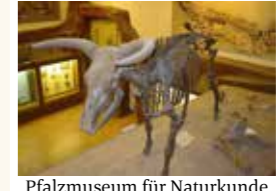
Pfalzmuseum für Naturkunde