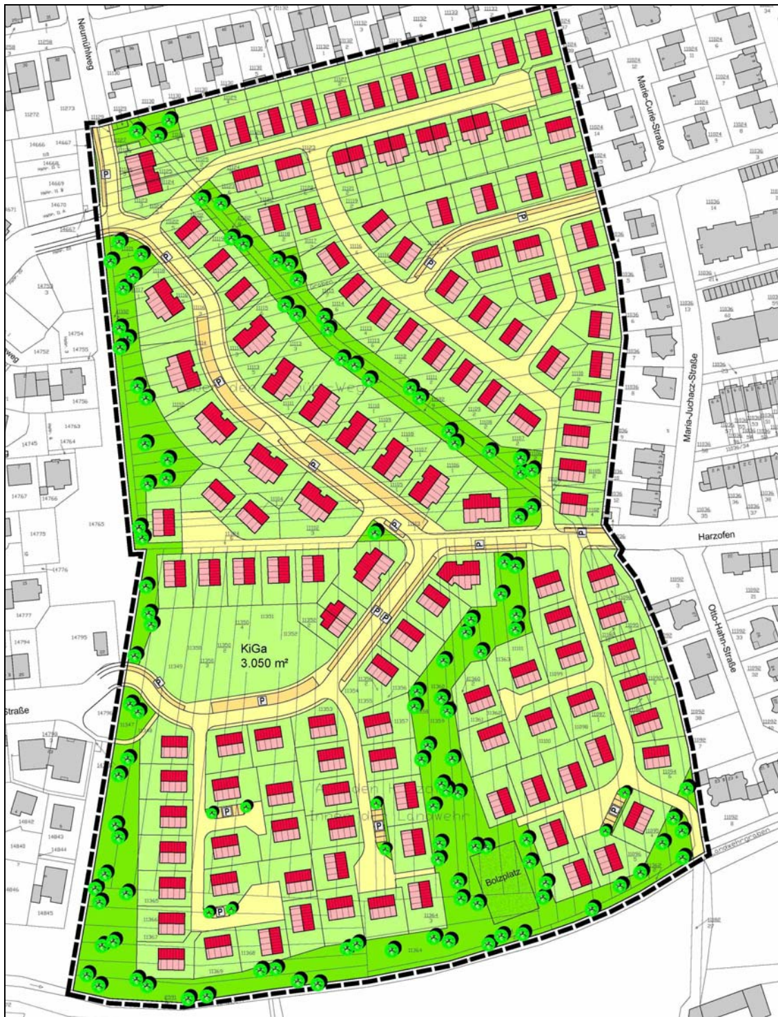
Städtebauliches Konzept, Stand November 2016

Die planerischen Grundgedanken des Gesamtkonzepts wurden dabei nahezu unverändert übernommen und lediglich punktuell an die aktuellen Bedürfnisse in der Gemeinde Haßloch angepasst. So wurde auf eine Ausweisung von Reihenhäusern nahezu vollständig verzichtet und der Anteil des Geschosswohnungs-