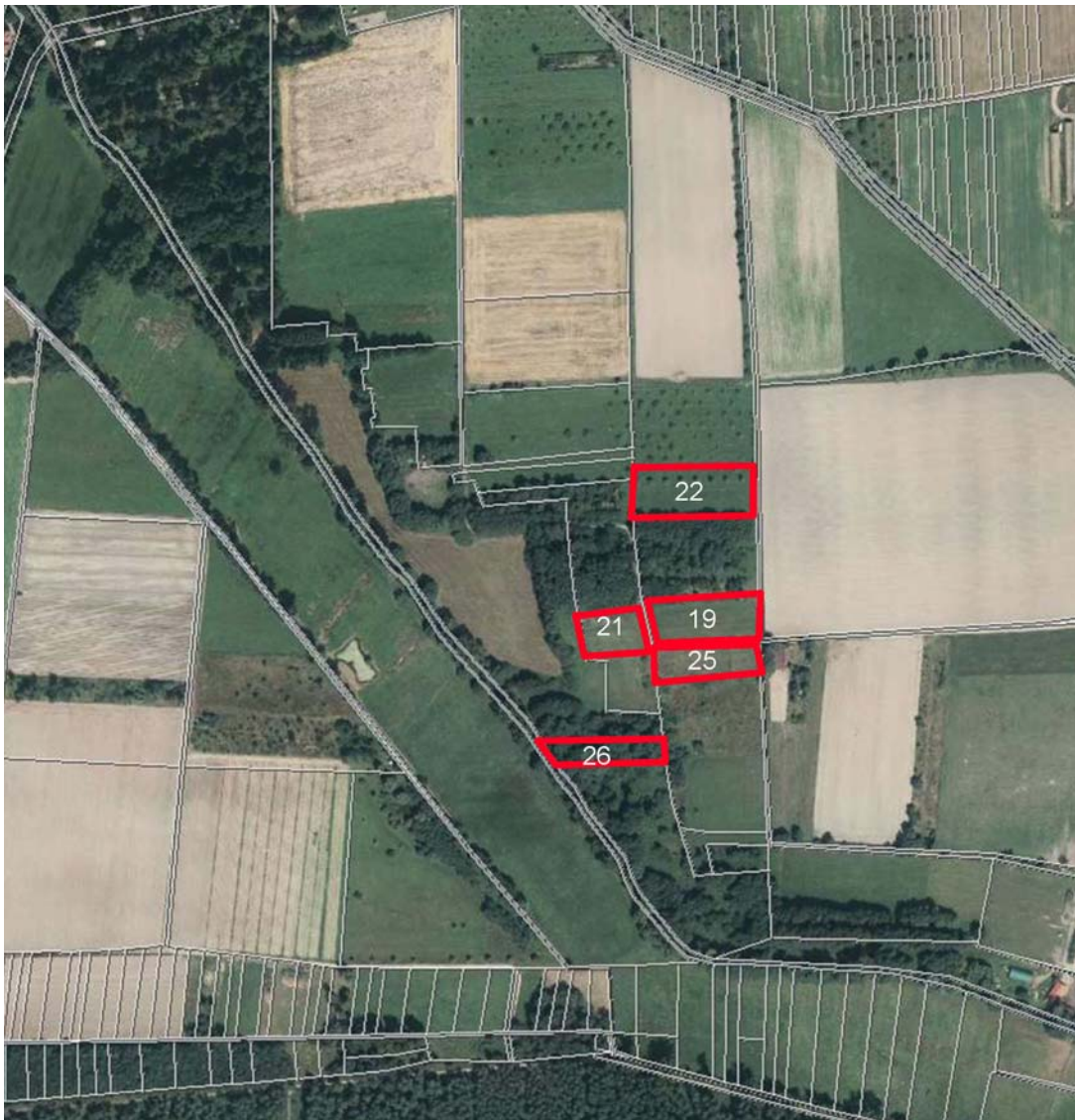
Ökokonto-Flächen der Gemeinde Haßloch mit Ökokonto-ID-Nummer