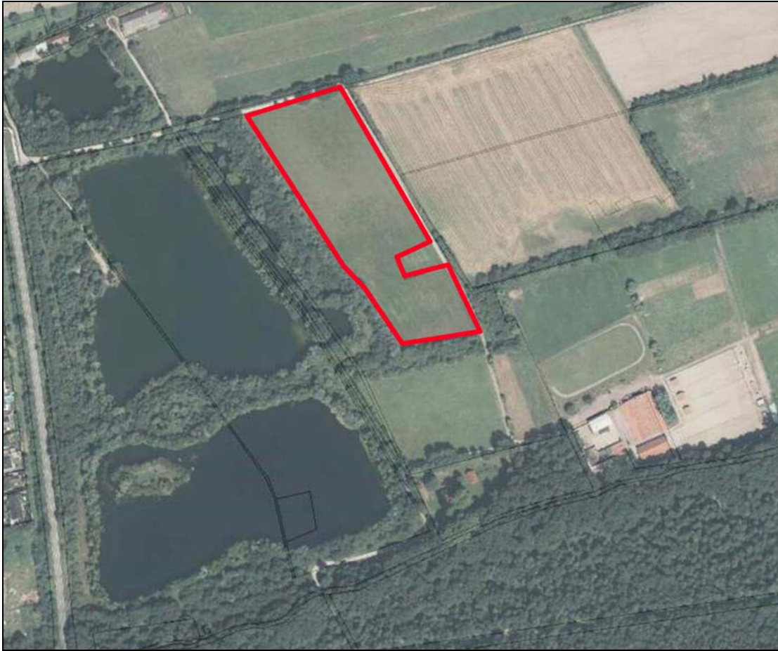
Ökokonto-Fläche des Kreises Bad Dürkheim; Gemarkung Haßloch, Flurstück 11475/9, verfügbare Teilfläche 18.900 m 2